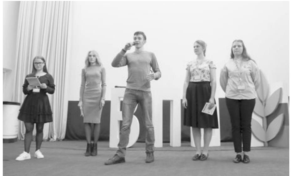
Об учителе будущего рассказывают победители Российской психолого-педагогической олимпиады школьников

«Я уверена, что деятельность учителя не должна ограничиваться преподаванием. У педагога должны быть интересы вне школы: занятия спортом, шитье, граффити, коллекционирование монет, игра на музыкальных инструментах или путешествия... Учитель играет важную роль в раскрытии и формировании личности ребенка. Не пробуя себя в