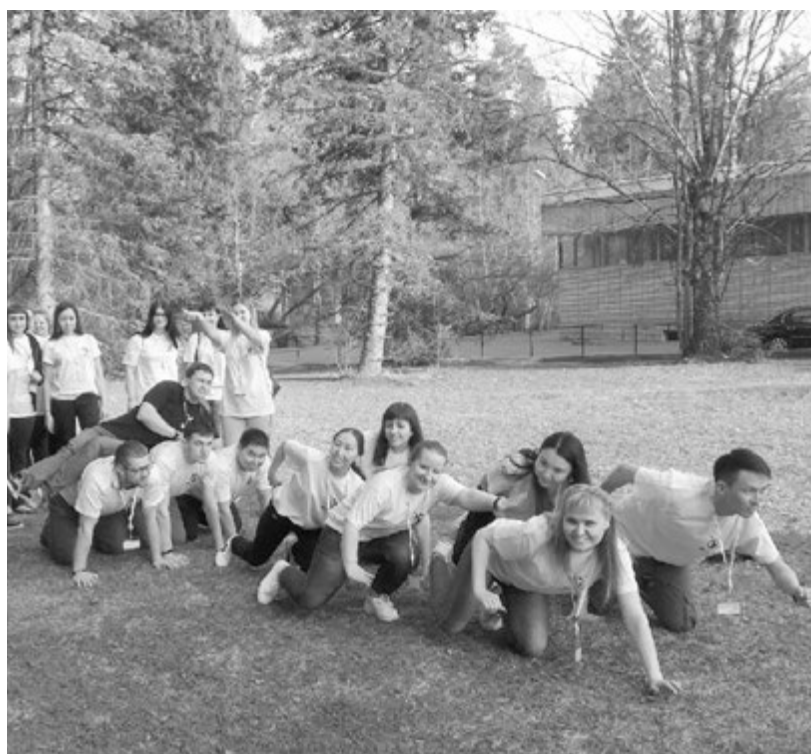
Команда «Белые ходоки»