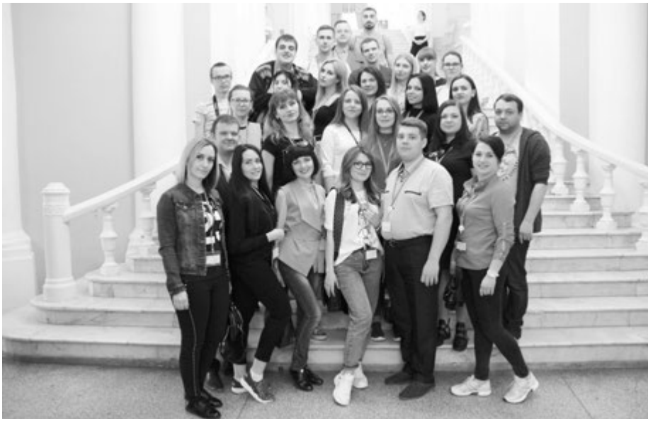
На лестнице РАМТа